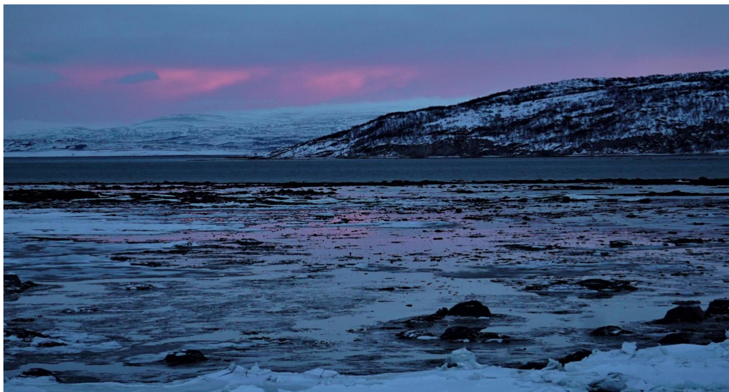
Riflessi rosa sulle acque parzialmente ghiacciate del fiordo di Porsanger

L'aurora boreale è un fenomeno atmosferico imprevedibile , e la sua visibilità non può essere garantita. Tuttavia, ci organizzeremo per massimizzare le probabilità di osservazione di questo meraviglioso fenomeno. I punti di stazionamento a noi noti permettono di scattare foto indimenticabili, con l'aiuto dei fotografi professionisti che vi assisteranno in maniera dedicata. Il programma può subire variazioni nell'ordine delle attività per ragioni di ordine logistico o dipendenti dalle condizioni meteo locali. In nessun caso sarà dovuto un rimborso per attività non effettuate o abbreviate a causa meteo. Durante il viaggio ci atterremo alle raccomandazioni sanitarie in vigore nei paesi visitati.